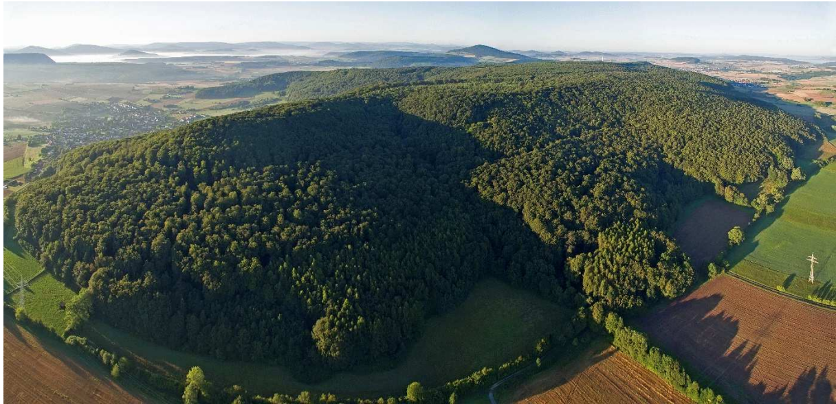
Foto: Naturwaldentwicklungsgebiet Landecker Berg (600 ha)

von 3,1% eigentlich ist und dass die Sorgen der Sägeindustrie unbegründet sind. Erkennen kann man aber einige schöne große Gebiete, wie den Nationalpark Kellerwald, das Naturschutzgebiet Kühkopf-Knoblochsaue, den Wispertaunus und den Landecker Berg, zwei davon wurden in der letzten Kernflächen-Tranche ausgewählt.