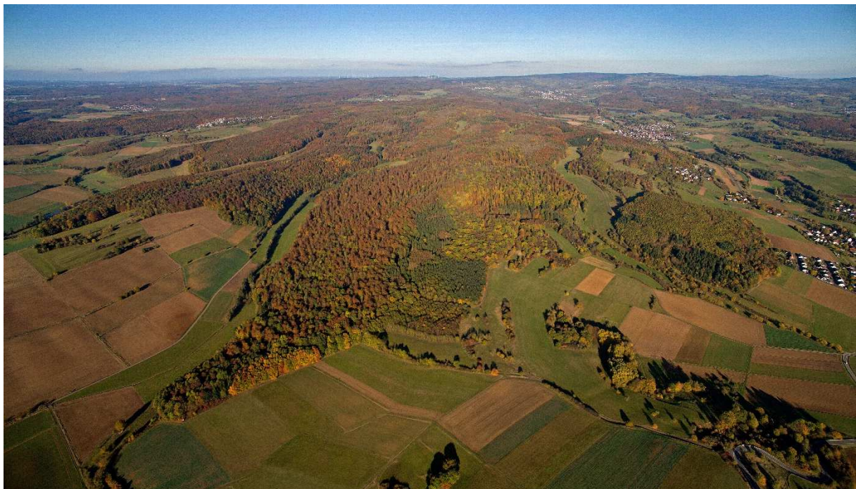
Foto: NABU-Gebietsvorschlag für einen Naturwald „Schotten-Süd-West“ (699 ha)

Der NABU wünscht sich daher nicht nur eine schnelle Vollendung des 5%-Ziels der hessischen Biodiversitätsstrategie, sondern vor allem eine Vollendung durch rund 20 große Schutzgebiete, die mit einer Größe von jeweils 500-1000 Hektar auch bundesweit herausragend wären. Denn kleine Gebiete schützen seltene Arten nur auf Zeit. Wir wollen keinen Teilzeit-Urwald, sondern Ewigkeitsprojekte. Nur große Gebiete sichern eine immerwährende Kontinuität der Habitats. Kleine Kernflächen mit nur einer Altersklasse brechen in 100 Jahren zusammen, und viele Arten gehen wieder verloren. Bis das vollzogen ist, brauchen wir ein Einschlagsmoratorium in den bekannten Gebietsvorschlägen!